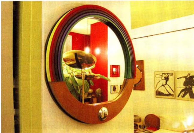
Janette Laverrière. «Demain». 2001. Bois de poirier vernis (Ph. Nairy Baghramian / VG Bild-Kunst). «Tomorrow.» Varnished pearwood